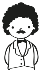
Personnages, événements et lieux historiques