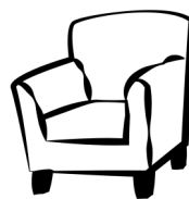
Meubles et autres objets