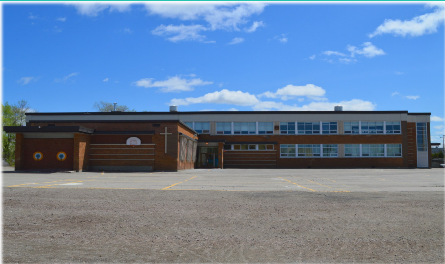
École Le Tandem, édifice Notre-Dame-du-Rosaire